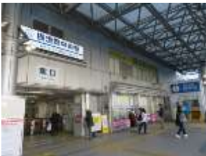
横須賀中央駅起点・終点