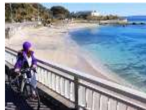
三浦半島東海岸(イメージ)