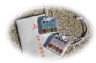
走行安全自転車守り